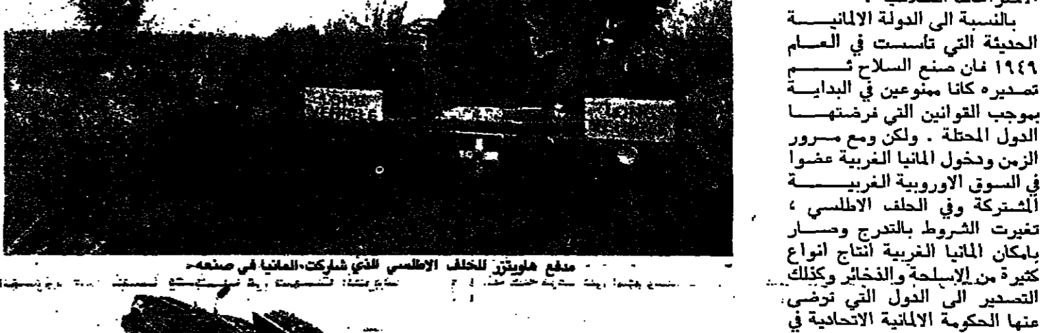
مدفع هاويتز للخلف الألماني الذي شاركته ألمانيا في صنعها

الأرجنتين تحصل على مدافع مصدرة إلى ألمانيا وجنوب أفريقيا لتسلم مصنع ذخيرة مشحون إلى الباراغواي من المتعارف عليه ان ألمانيا الغربية فقيرة جدا بالنظ وان كمالها لا يتعدى بضعة ابار لاتراخت التجربة في مياها الإقليمية او ما خصص لها من مياه بحسب الشمال. ومن الأساس فان الإنتاج الصناعي في ألمانيا الغربية هو «اللفظ» الذي يدبر المال الوفير. الإلمان كان - نظرياً - واحداً من المصادر الرئيسية للثروة. ولوان الظروف السياسية المناسبة كانت تخدم حصر البيع بالحكومة الألمانية او بالدولة التي ترضى عنها تلك الحكومة. لكن ومن ناحية اجالية كانت الشركات الصناعية الألمانية تجني المال الكثير من انتاجها وتخصص جزءاً من ارباحها لتطوير الاختراعات المسلحة.